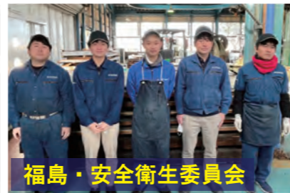
福島・安全衛生委員会