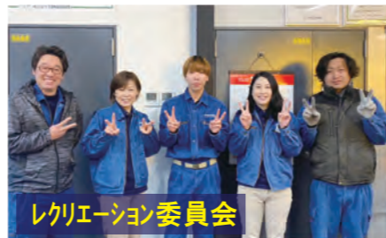
レクリエーション委員会