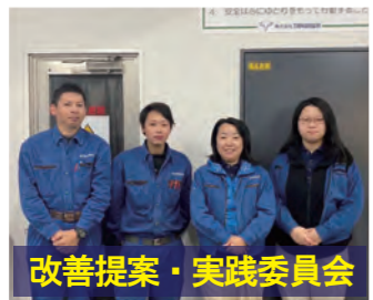
改善提案・実践委員会