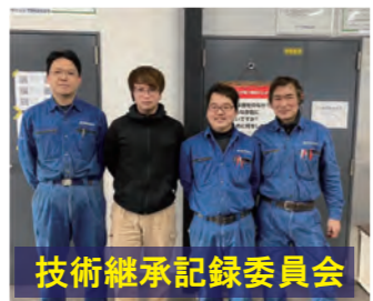
技術継承記録委員会