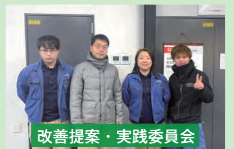
改善提案・実践委員会