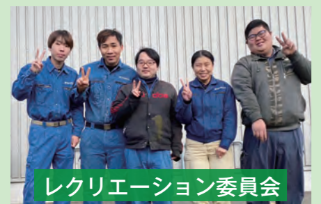
レクリエーション委員会