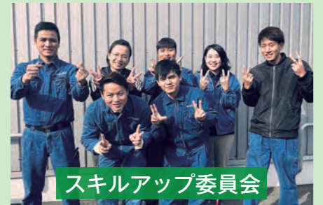
スキルアップ委員会

今期の各種委員会メンバーをご紹介します。福島工場でも「安全衛生委員会」「レクリエーション委員会」が発足し今後の活動が期待されます。