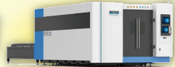
高出力レーザー切断機