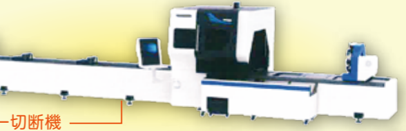
3チャックパイプレーザー切断機