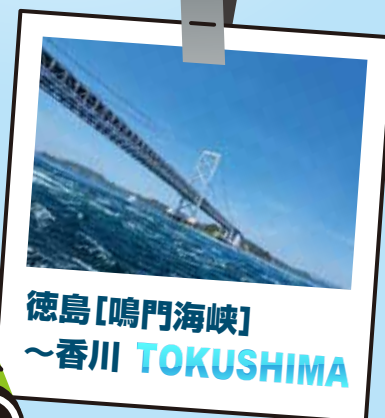
徳島[鳴門海峡] ～香川 TOKUSHIMA