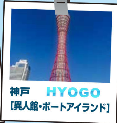
神戸 HYOGO [異人館・ポートアイランド]