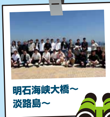
明石海峡大橋～ 淡路島～

2日目は、全員で明石海峡大橋～淡路島～鳴門海峡(徳島)～香川県へ行き、グループ会社の(有)松下建材塗装で工場見学をして、塗装のライン作業を学びました。