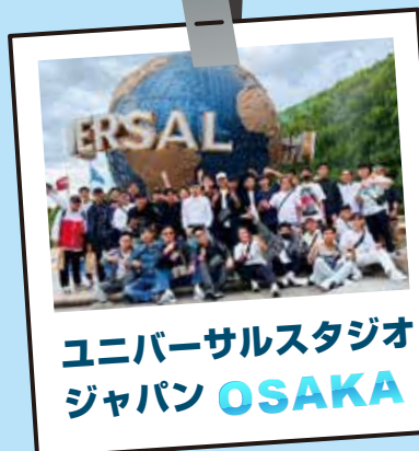
ユニバーサルスタジオ ジャパン OSAKA

1日目はUSJと神戸観光に別れて行動し、ベトナムの社員には初めてテーマパークに行く人も多く、みんなで思う存分楽しむ事が出来ました。神戸観光組は、異人館・ポートアイランドを満喫しました。