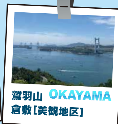
鷺羽山 OKAYAMA 倉敷[美観地区]